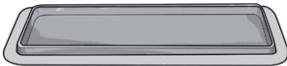
Tray uit PP of APET