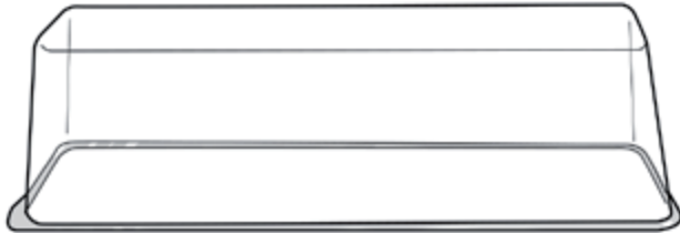
Deksel anti fog behandeld in PP of APET