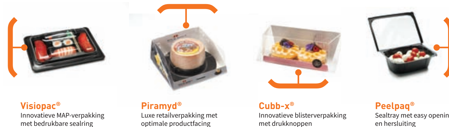
Visiopac® Innovatieve MAP-verpakking met bedrukbare sealring